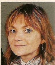
par Sandrine OTSMANE

Éducateur canin &amp; Comportementaliste Chien et Chat Certifiée